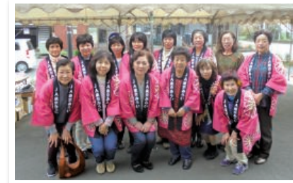
JA東京みらい清瀬地区 女性部の皆さまより、ご寄付をいただきました。