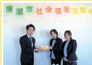
第一生命の皆さまより、食品のご寄付をいただきました。