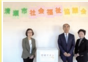
東村山法人会女性部会の皆さまより、タオルのご寄付をいただきました。