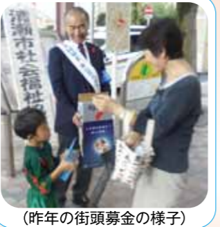
(昨年の街頭募金の様子)

共同募金には、税法上の特典があります ・法人による寄付金は、全額損金算入できます。 ・個人の寄付金は、所得税控除対象です。