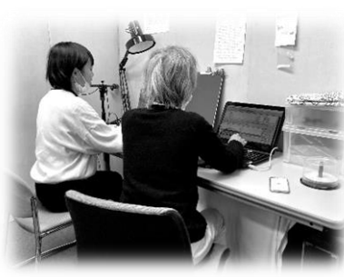
「清瀬市・声のボランティア」 にご協力いただき録音しました

歳末たすけあい運動でお寄せいただいた募金は、清瀬において生活困窮者の応急支援金や被災者への見舞金その他、地域のつながりや地域の福祉力を高めていく、たすけあい活動に活かされます。