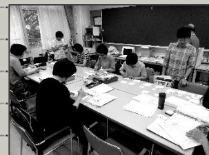
これまでの 活動の様子

コロナ禍において、日頃の活動場所が制限されてしまい、会員同士で集まることが難しくなっていました。そのような状況下で、Zoom（ズーム）を使い、現在は月1回の定例会をオンライン上で開催しています。また、Zoom（ズーム）を導入することにより、「対話不足が緩和され、作業チームごとの細やかな打ち合わせに自宅から参加でき、時間の調整もしやすくなって便利になった」と会の方よりお話がありました。対面を避けながらも、必要な方に点訳をお届けできるように、オンラインなど上手に活用しながら活動を進めています。