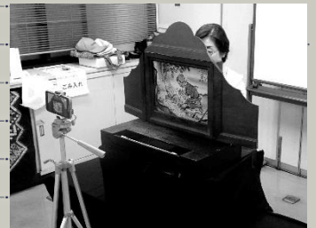
お気に入りの作品を 動画撮影しました