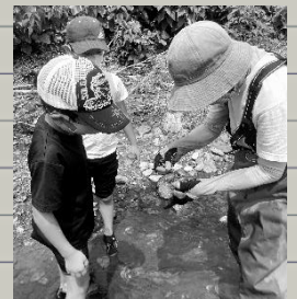
初めて見る生き物 たちがたくさん！

川の清掃と、生き物観察を通じて、自分たちの身近にある柳瀬川は生き物たちであふれ、生命力豊かな場であること。それは、多くの人の支えがあり維持されていることを、子どもたちは体験し、学んだ貴重な時間となりました。