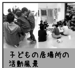
子どもの居場所の活動風景