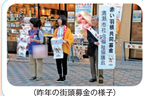
(昨年の街頭募金の様子)