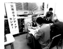
災害ボランティア講座

災害ボランティア学習会の実施や地域防災訓練への協力などを通じて、災害ボランティア活動、登録制度の啓発を行っています。また、昨年9月に発生した台風15号の被害による被災地支援のため、センター職員も千葉県安房郡の鋸南町災害ボランティアセンターに応援スタッフとして関わりました。