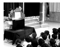
幼稚園で紙芝居を披露

福祉施設や病院、保育園、活動団体など様々なボランティアプログラムを実施しています。今年度は小学生を中心に約 280 名が参加しました。