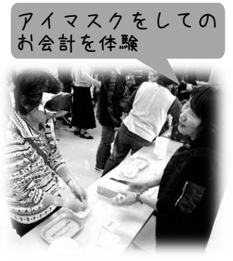
アイマスクをしてのお会計を体験