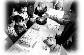
スタンプラリーのゴール会場