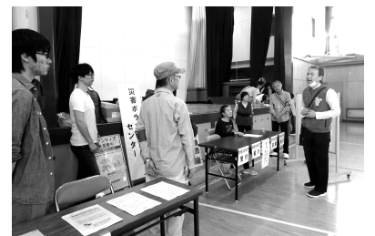
清瀬市の水防訓練にて災害ボランティアとして活動