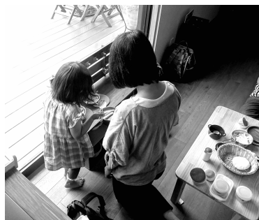
子育て支援カフェにて子どもの見守り