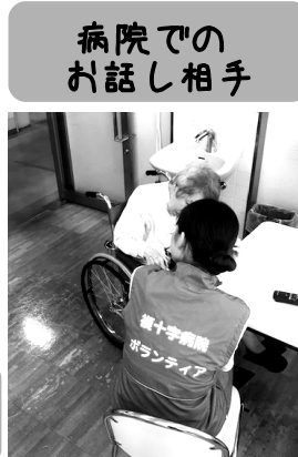
病院でのお話し相手