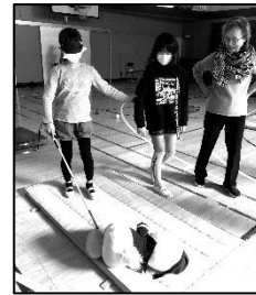
介助・白杖歩行体験やゴールボールなどを体験しました。

最初に「白杖歩行」「アイマスクをしてのお買い物」「ゴールボール(障害者スポーツ)」の3つの体験を行いました。次にグループあかりの皆さんから「普段の生活で困ること」「工夫していること」を「こんな風に接してほしい」など、視覚障害をもつ方の当事者視点のお話があり、子どもたちはもちろん先生や保護者の方々も真剣に耳を傾けていました。