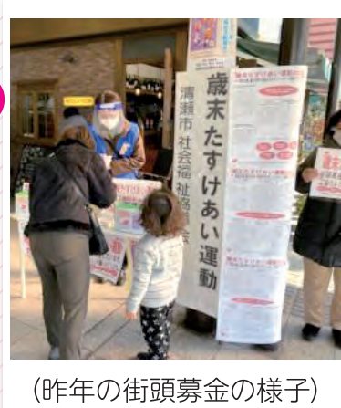
(昨年の街頭募金の様子)