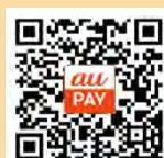
「赤い羽根共同募金運動」専用のQRコード

au以外のキャリア(携帯会社)でも、auPAYアプリをインストールいただき、専用QRコードを読み取ることで募金できます。