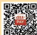
「歳末たすけあい募金運動」専用のQRコード