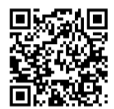
社協 特例貸付 ホームページ

新型コロナウイルスの影響を受け、休業等により収入減少があり、緊急かつ一時的な生計維持のため貸付を必要とする世帯への貸付を行っております。緊急事態宣言の長期化による雇用情勢悪化で申請が相次いでいる実情から、6月末の申請期限を8月末まで2カ月間延長することとなりました。お困りの方は、お電話にてご相談いただけますようお願い致します。