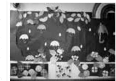
▲(廊下) 清瀬ひまわり園 季節の飾りつけ

障害者福祉センターでは、作品の展示や季節に合わせた飾りつけを行っています。外へ出る機会は減っていますが、みんなで一緒に飾りつけを行い、来館者の目を楽しませています。作品や飾りつけは随時更新中です!