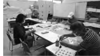
▲いきいき会議 作業風景